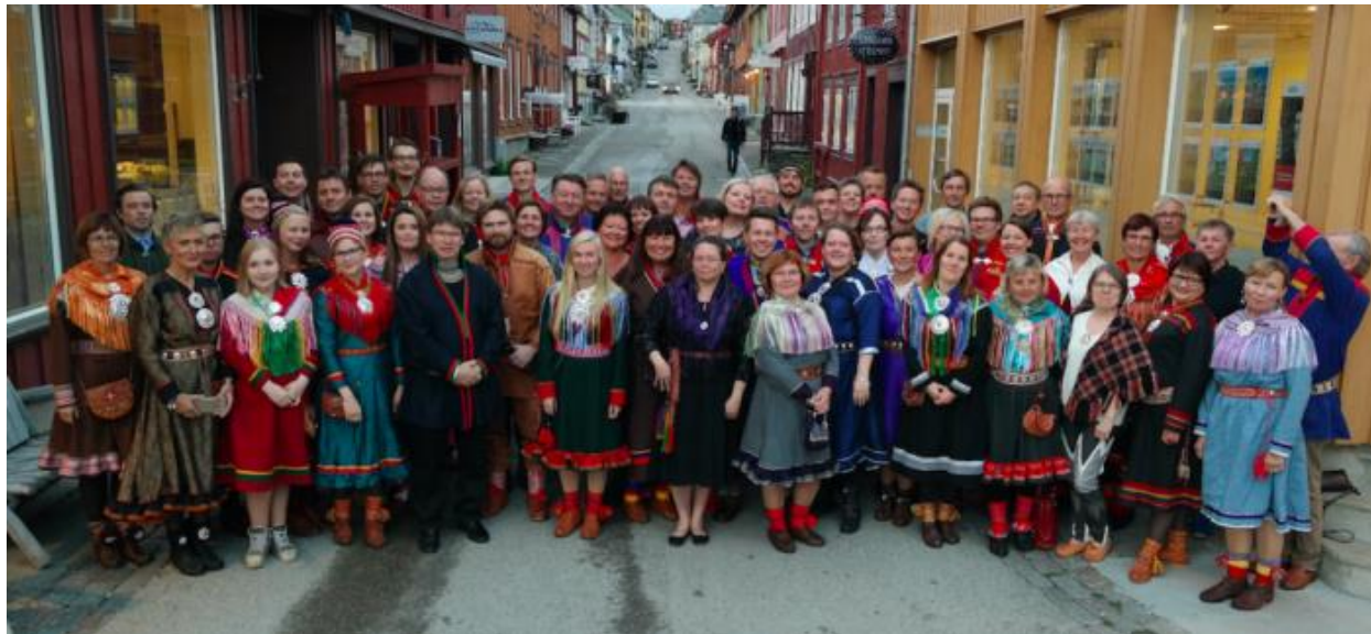
“Vil fyller Røros’ gater.”